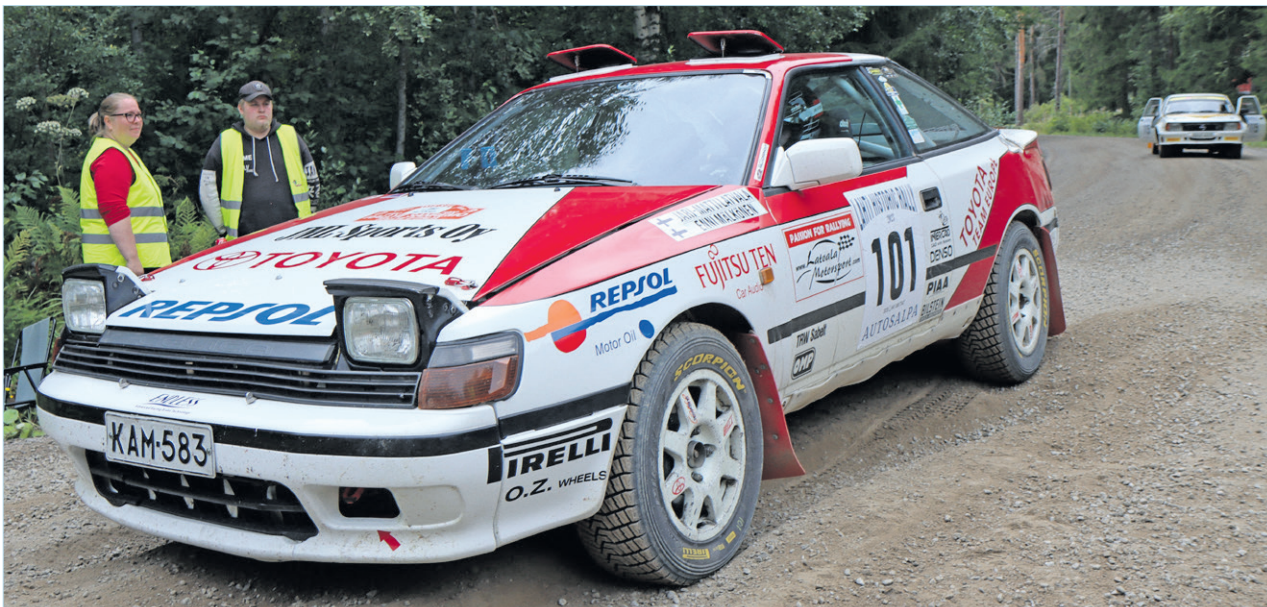
Lahti Historic Rallin lauantain yksi erikoiskoe oli Padasjoella. Jo 10 vuotena ralliauto ovat ajaneet Neroskulman 12 kilometrin reitin. Rallin voittaja Jari-Matti Latvala piti Neroskulman erikoiskoetta rallin parhaimmista: – Hienoja teitä, todella hienoja. Ihan parhaimpia koko rallissa, kivoja nyyppylöitä ja mutkia, kuvaili ensimmäisenä EK:lle kaasutellut ralliammattilainen. Autoisten kyläyhdistys myi lippuja Jallinmäellä ja Myllärinristeyksessä.